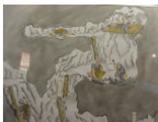
↑ 当時の採掘の様子