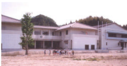
大田市立久屋小学校